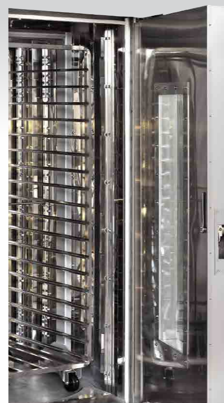
> CARRELLO TROLLEY