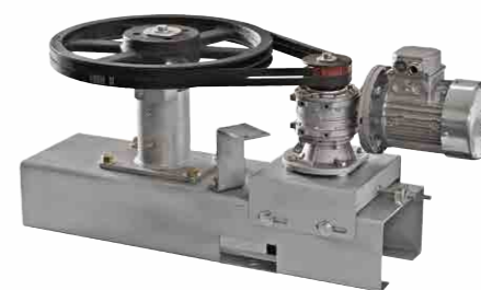
> GRUPPO MOTORE MOTOR UNIT