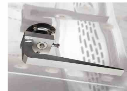
> AGGANCIO SUPERIORE UPPER HOOKING SYSTEM

I forni ROTOR CR presentano tre sistemi di aggancio del carrello: > a piattaforma girevole > con aggancio superiore > con agganciamento automatico carrello Le versioni con aggancio superiore e sollevamento automatico consentono una perfetta pulizia della base del forno secondo le vigenti norme igieniche.