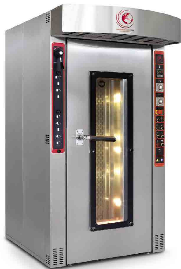
mod. CR Mini 12 50/70

Thanks to the experience acquired through many years of presence in the market, we propose CR Mini , a small rotor oven, but really great for its functionality and flexibility of use. Thanks to the steam engine as standard, and its 12 trays, it can satisfy confectionery and bakery needs. It works also with gas oil, methane, GPL burner or electricity.