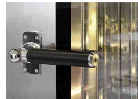
> SISTEMA DI CHIUSURA CLOSING SYSTEM