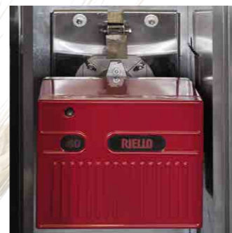
> BRUCIATORE BURNER