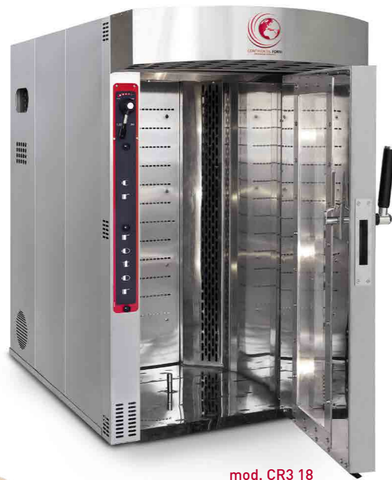
mod. CR3 18 80/100