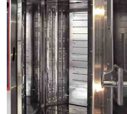
> CAMERA DI COTTURA BAKING CHAMBER